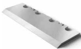
Chipper knives and accessories Hackmesser und Zubehör