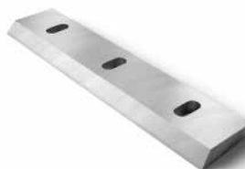
Recycling knives Wiederverwertungsmesser