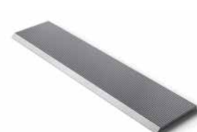
Knives for secondary processing of wood Messer zur sekundären Holzbearbeitung