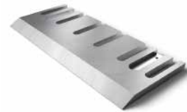
Knives and parts for production of particle boards, MDF and OSB boards Schneidmesser zur Herstellung von Holzspan-, MDF- und OSB-Platten