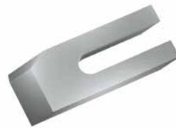
Knives and parts for Sawmills Messer und Zubehör für Sägewerke