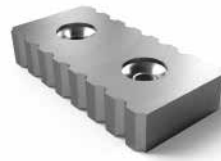
Knives for scrap metal recycling Messer zum Schneiden von Eisenschrott